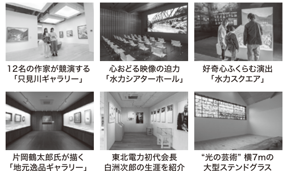
12名の作家が競演する「只見川ギャラリー」